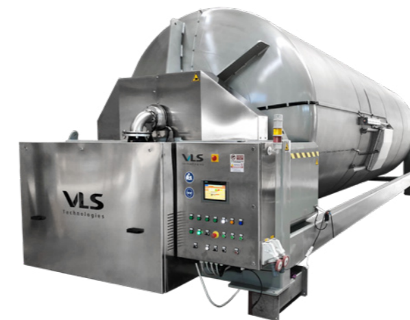
Pressa pneumatica Pneumatic press PSC 250 / PSC 320 / PSC 440