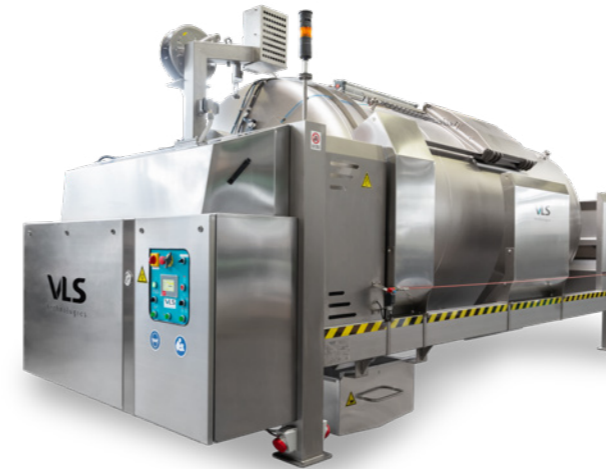
Pressa pneumatica a tamburo chiuso Pneumatic press with closed tank PSC 80 / PSC 100 / PSC 150