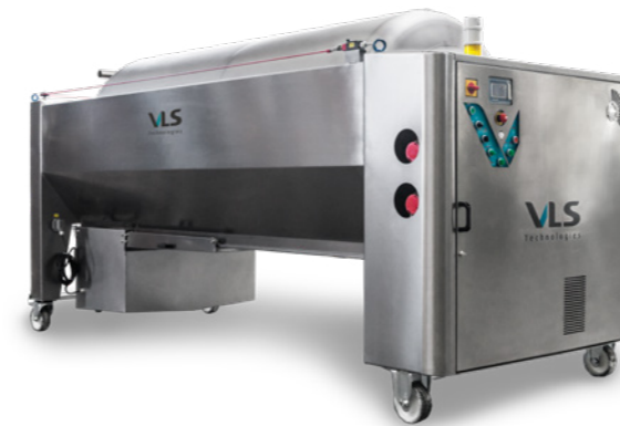
Pressa pneumatica a tamburo chiuso Pneumatic press with closed tank PSC 10 / PSC 15 / PSC 22 / PSC 30 / PSC 50